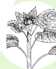
Finale iniezione floreale 55-60 giorni