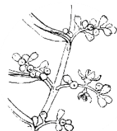
Comienzo de la floración