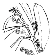
Aparición de los racimos de flores