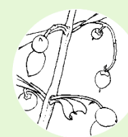
Momento de la cosecha